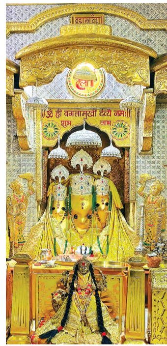
और मोक्ष दोनों ही प्रदान करती है।